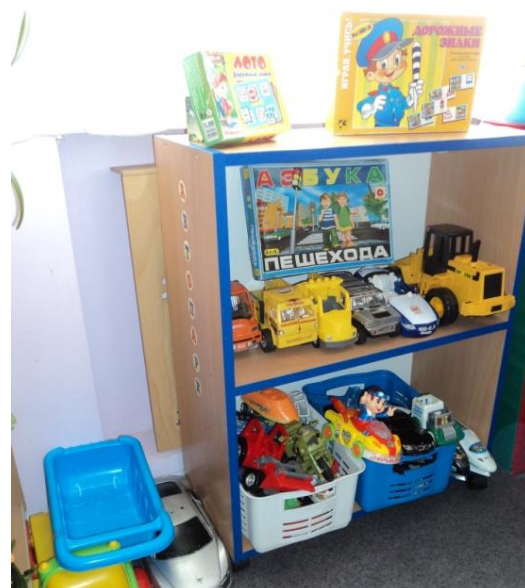
Уголки безопасности дорожного движения