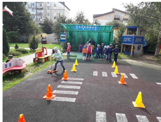
Площадка по БДД